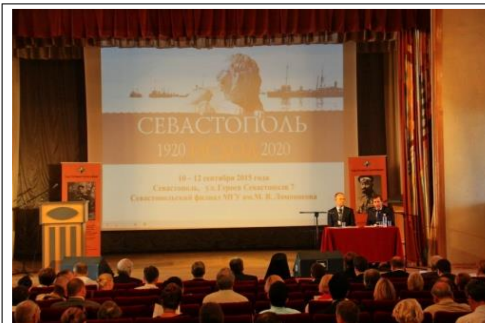
В конгресс-холле севастопольского филиала МГУ. Здесь собрались участники Международной научно-просветительской конференции «Крымский пролог...»